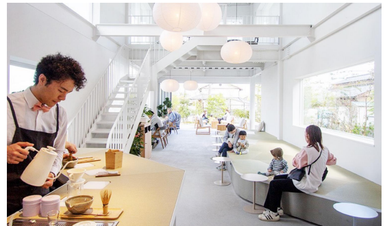
(TATAMI VILLAGE の様子)

ホームページには「使命は畳を後世に残すこと」「夢は畳を世界へ広めること」と明確な使命と夢を宣言されています。後世に残すためにも、消費者から「畳はいいね。い草はいいね」と感じて頂けるような品質の良い畳表を提案して頂く事が重要と思いますが、若くしてこれらを実践・行動されている事に敬意を表します。その実践されている事は多くの人に聞いて頂きたいと思います。