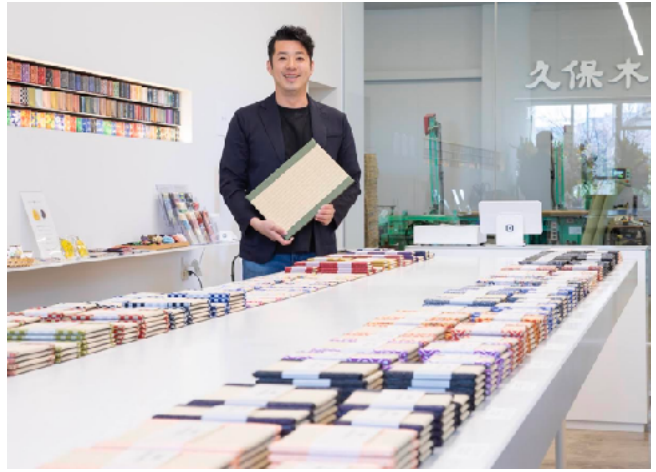
(TATAMI VILLAGE にて)

1987年福島県須賀川市生まれ。大学進学を機に上京し、卒業後は都内の建設会社に勤務。畳業界の厳しい現状や家業の苦境がつつられた父（社長）からの手紙をきっかけに31歳で退職。2020年1月より久保木畳店に入社。