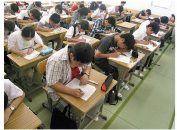
▲ 畳の教室(英進館、福岡市)

英進館に所属の中学1年生及び小学5年生の323名(男196名・女127名が対象)